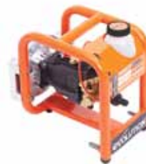
PW3200 VYSOKOTLAKÝ ČISTIČ