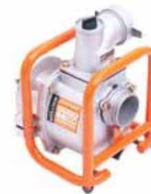
DWP1000 ČERPADLO NA VODU