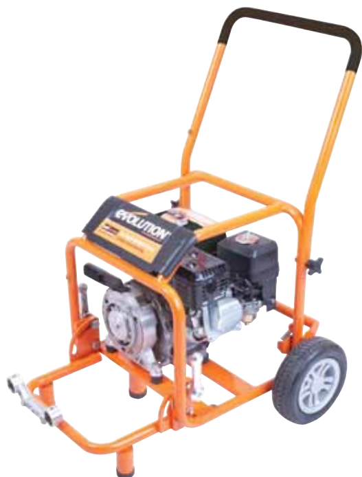
GT600 MITSUBISHI MOTOR SE SPOJKOU